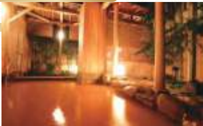
有馬ロイヤルホテル