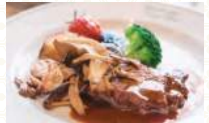
レストランカフェ Elle Bon