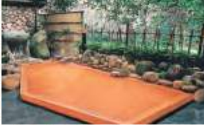
月光園 鴻臚館・游月山荘