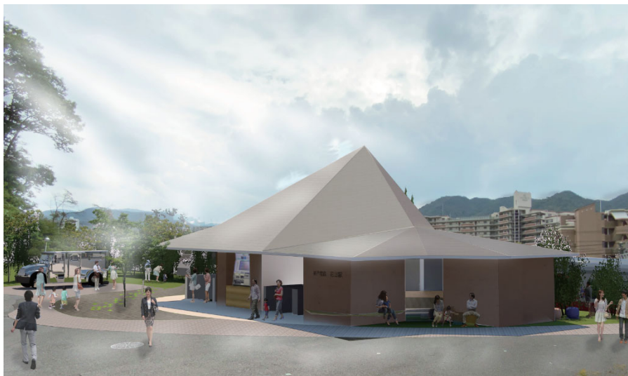
鉄道と地域、そして人々をつなぐ新たなシンボル拠点へ (2021年度末供用開始予定の有馬線花山駅新駅舎周辺イメージ)

これから私たちの駅を、日常の何気ない通過点から、ここへ訪れたいと思える目的地へと“モヨウガエ”していきます。あなた次第で幾重にも夢広がる“駅発ストーリー”を神鉄沿線で創り上げてみませんか？