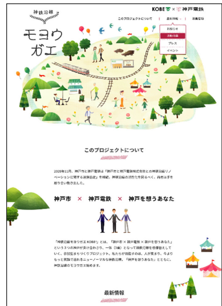
「神鉄沿線モヨウガエ」公式サイト