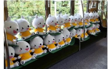
しんちゃんぬいぐるみ