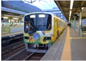
谷上駅 2 番線 展示イメージ