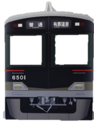
6 5 0 1 号車 顔出しボード