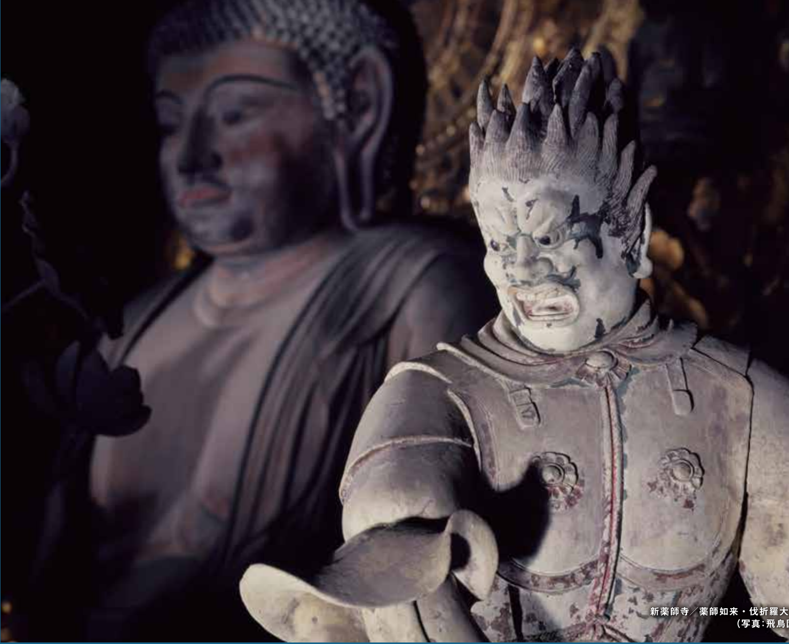
新薬師寺・薬師如来・伐折羅大将