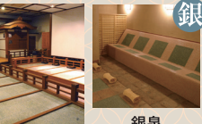
黄金の蒸し風呂 麦飯岩盤床 蒸し風呂岩盤浴