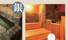
銀泉 かつろぎの湯