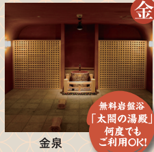
ねねの蒸し風呂 太閤の蒸し風呂 蒸し風呂岩盤浴