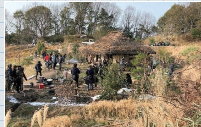
茅葺の家のセット (撮影後に解体され、現在はありません)