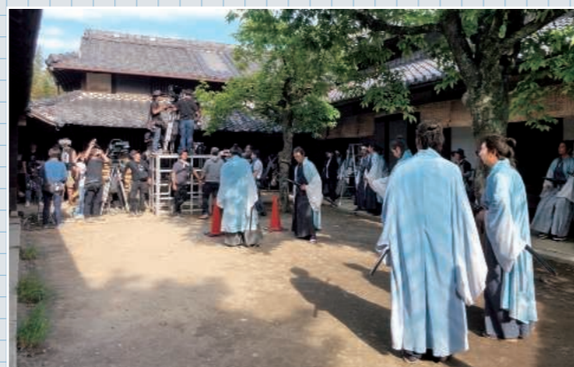
新選組屯所のシーン