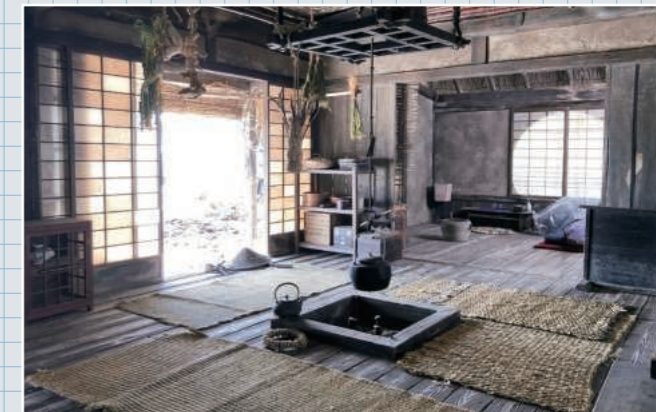
茅葺の家の内部 囲炉裏や土間など細かいところまで作り込まれました