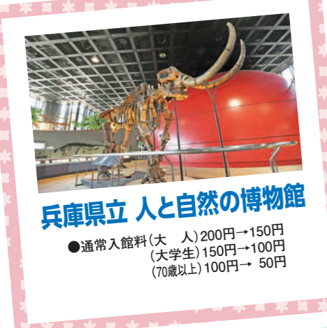
兵庫県立 人と自然の博物館

●通常入館料(大人)200円→150円 (大学生)150円→100円 (70歳以上)100円→50円