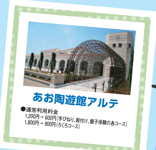
あお陶遊館アルテ

●通常入館料(大人)200円→150円 (大学生)150円→100円 (70歳以上)100円→50円