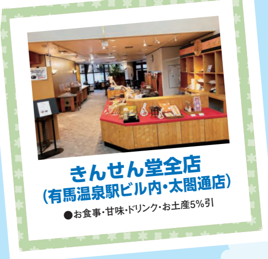
きんせん堂全店 (有馬温泉駅ビル内・太閤通店)