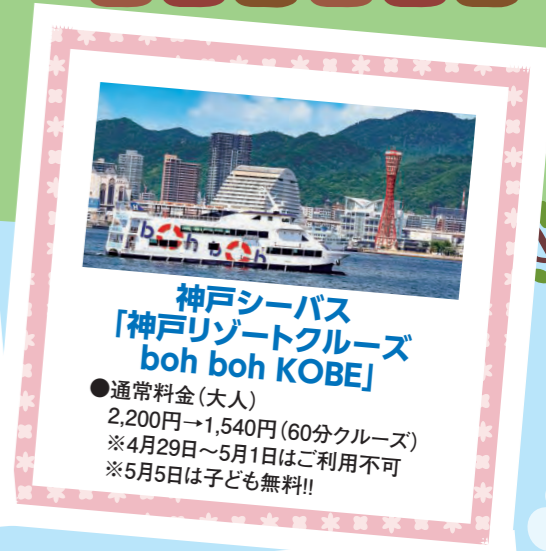
神戸シーバス 「神戸リゾートクルーズ boh boh KOBE」

●通常料金(大人) 2,200円→1,540円(60分クルーズ) ※4月29日～5月1日はご利用不可 ※5月5日は子ども無料!!