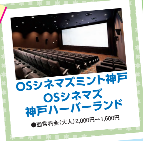
OSシネマズミント神戸 OSシネマズ 神戸ハーバーランド