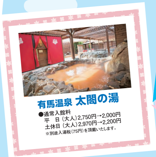
有馬温泉 太閤の湯

●通常入館料 平日(大人)2,750円→2,000円 土休日(大人)2,970円→2,200円 ※別途入湯税(75円)を頂戴いたします。