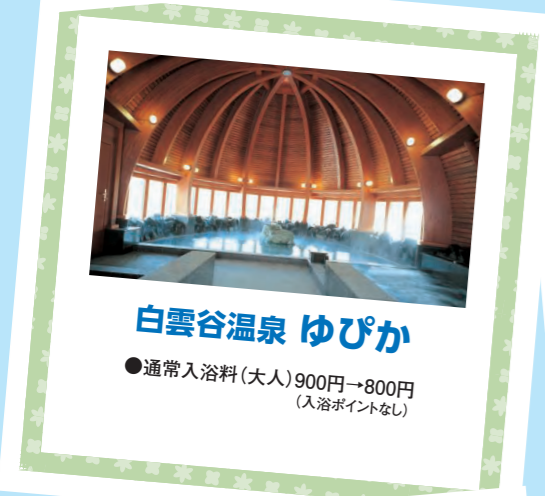
白雲谷温泉 ゆぴか

●通常利用料金 1,200円→600円(手びねり、絵付け、親子体験の各コース) 1,800円→900円(ろくろコース)