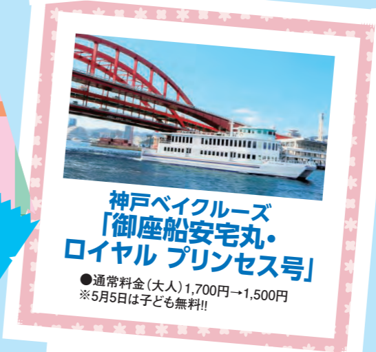
神戸ベイクルーズ 「御座船安宅丸・ ロイヤル プリンセス号」

●通常料金(大人) 2,200円→1,540円(60分クルーズ) ※4月29日～5月1日はご利用不可 ※5月5日は子ども無料!!