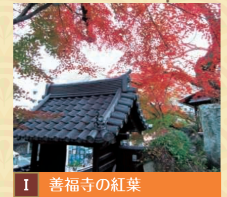
I 善福寺の紅葉 【駅から徒歩約5分】 行基によって創建されたとされる古刹に彩る紅葉は雅な趣が深いです。