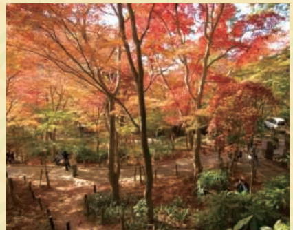
IV 瑞宝寺公園の紅葉 【駅から徒歩約20分】 有馬一の紅葉の名所で秀吉が「いくら見ても飽かない」言わしめた庭があります。