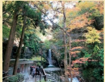
III 鼓ヶ滝公園の紅葉 【駅から徒歩約18分】 滝に続く道は紅葉や楓が覆われ紅葉のトンネルが迎えてくれます。