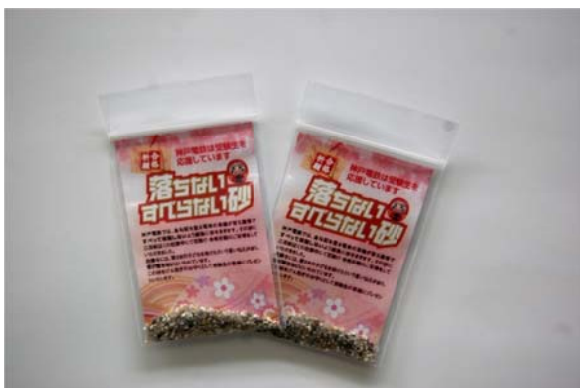
落ちない・すべらない砂

当社では、本プロジェクトの先行イベントとして、2016年1月、電車の車輪がすべて空転しないよう線路にまいている砂を活用した「落ちない・すべらない砂」（合格祈願のご祈符をしたお守り）を受験生の皆さんにプレゼントしたところ、大変ご好評をいただきました。本プロジェクトを通じて、より多くの皆さんに喜んでいただけるよう、イベントの開催やグッズの販売等を企画していきますのでどうぞご期待ください。